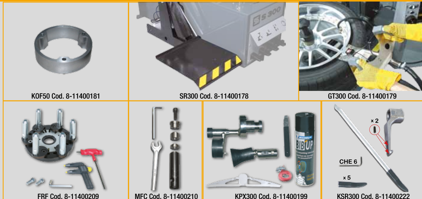
KOF50 Cod. 8-11400181