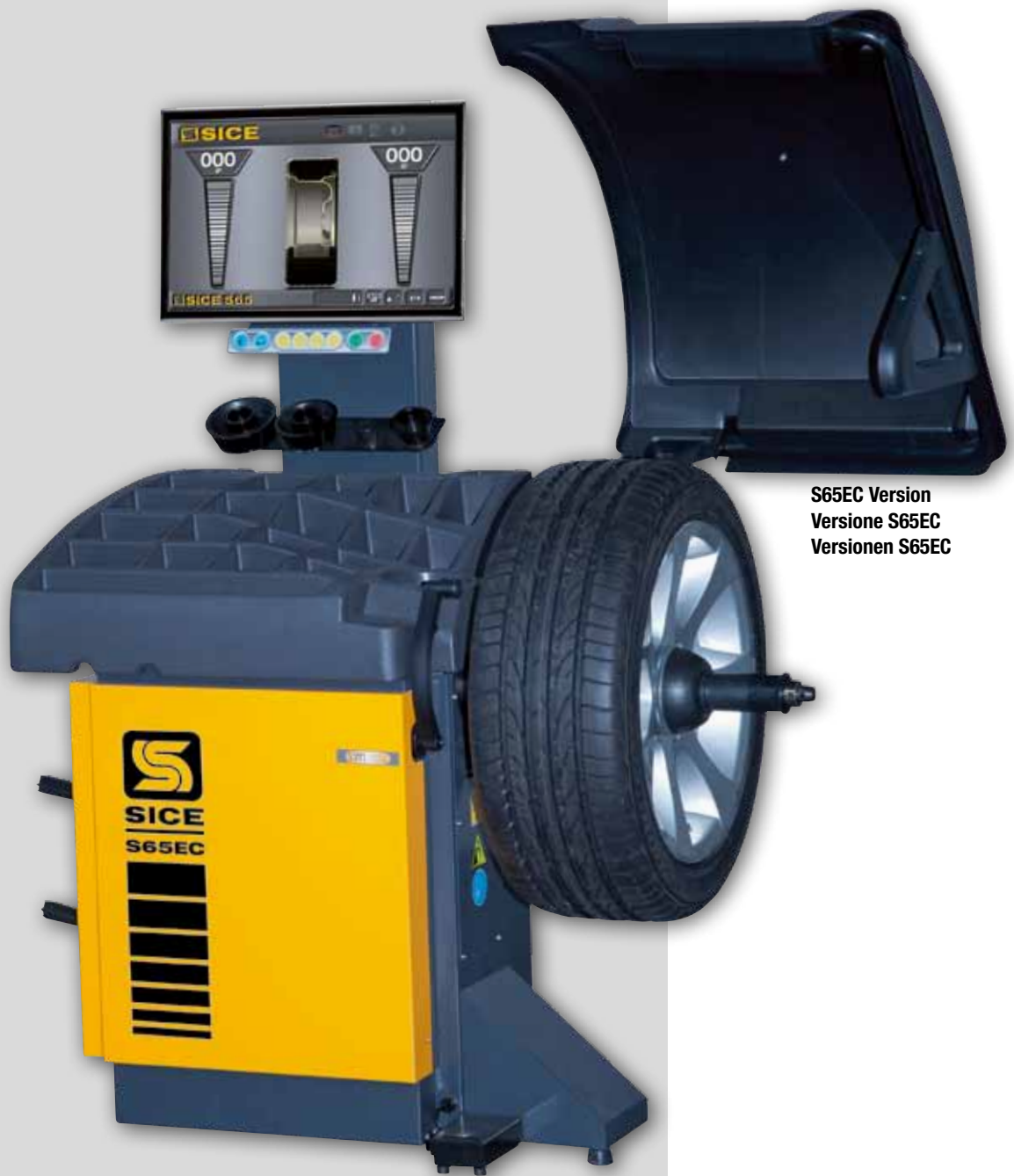
S65EC Version Versione S65EC Versionen S65EC