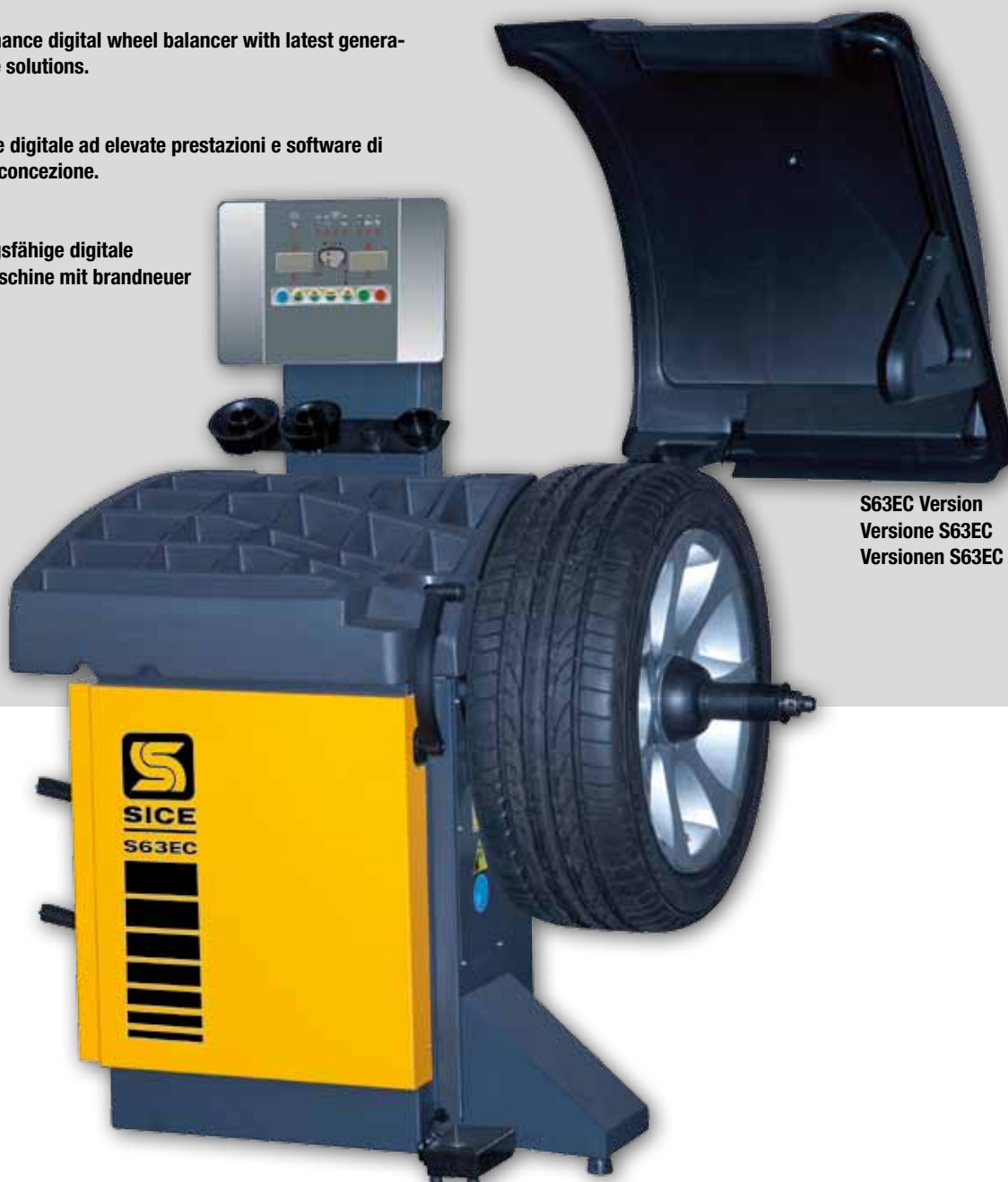
S63EC Version Versione S63EC Versionen S63EC

DE • Hochleistungsfähige digitale auswuchtmaschine mit brandneuer Software.